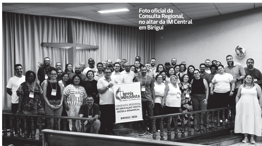
Foto oficial da Consulta Regional, no altar da IM Central em Birigui