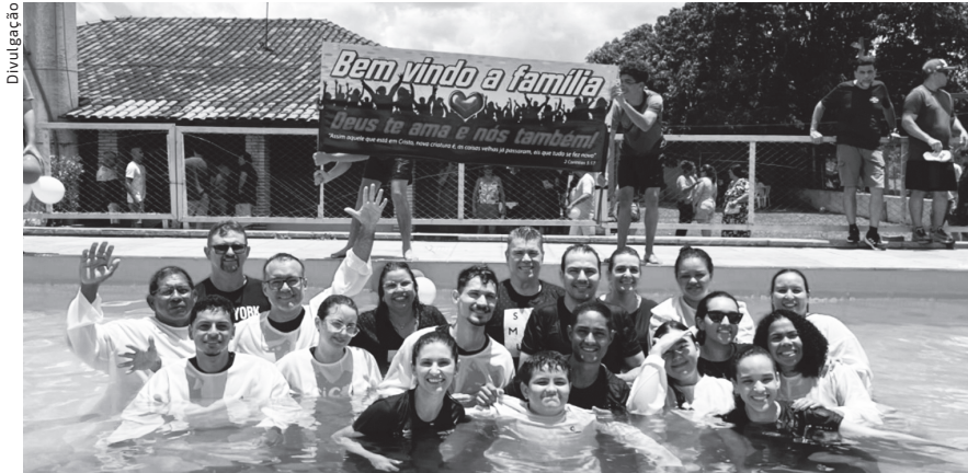
Domingo foi marcado por batismo e gratidão pelos novos membros