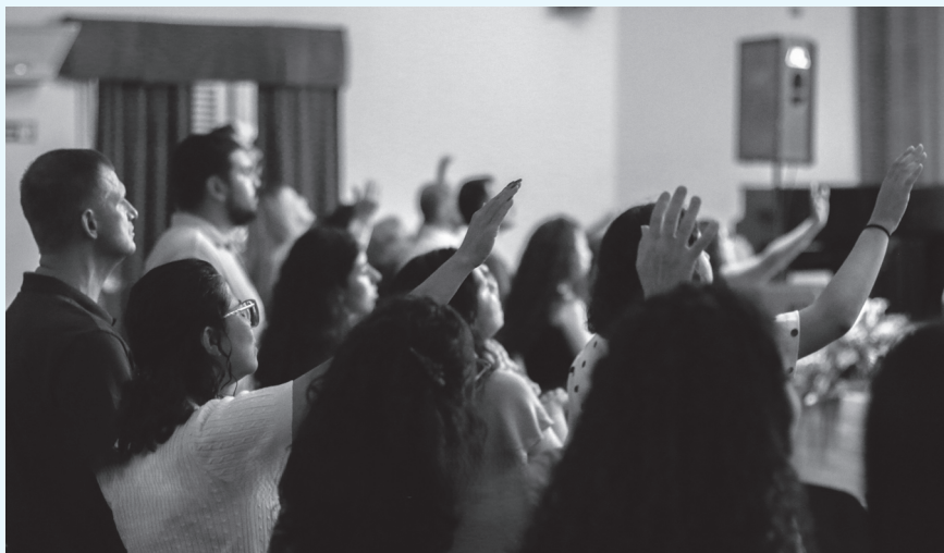
Gratidão e louvor marcaram o culto de autonomia