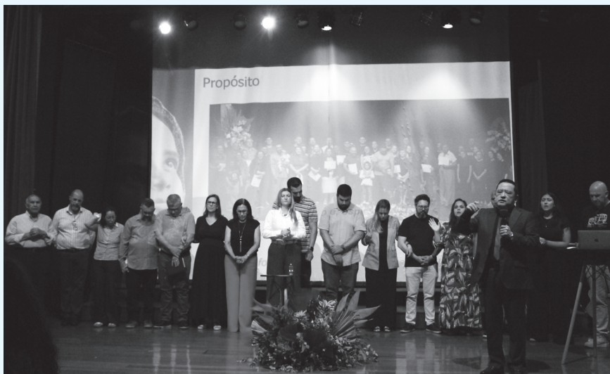
Momento de consagração e intercessão pela nova comunidade