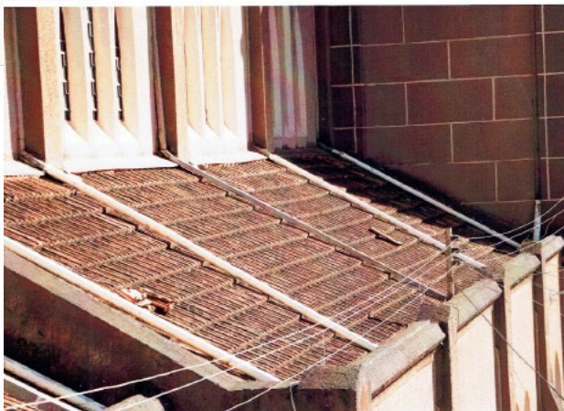
Figura 1 – Imagem cobertura Igreja de Ourinhos-SP