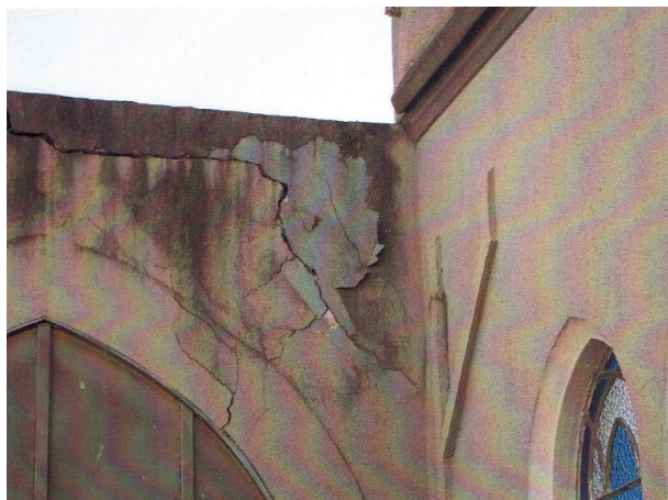
Figura 2 – Imagem de fachada da Igreja de Ourinhos-SP