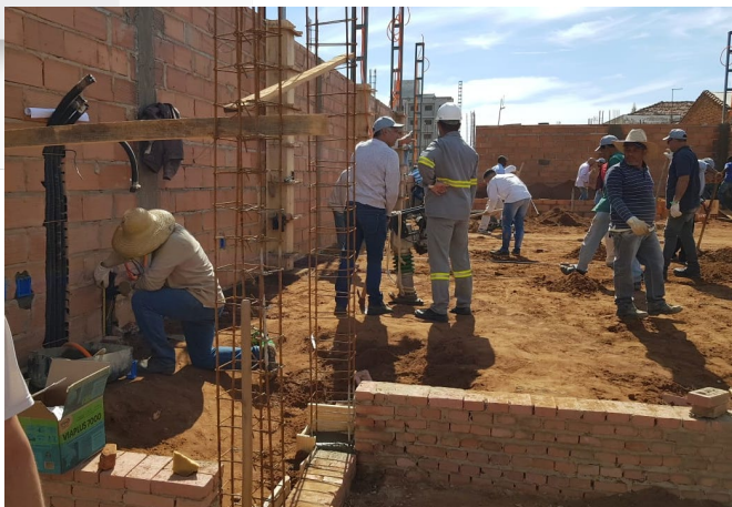
Figura 5 - Construção durante o PMUSPJ 2019